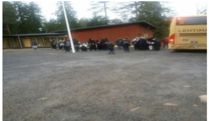
Tyttöjen leiri 23.-25.12.2016

Keräsimme palautetta leiriläisiltä sekä ohjaajilta. Leiriläisten palautteesta kävi ilmi, että tytöt kaipaavat vain tytöille suunnattua toimintaa, missä he voivat rauhassa miettiä tyttöyteen ja naiseksi kasvamiseen liittyviä asioita.