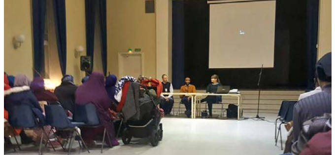
Liiton edustajat Oulussa seminaarissa.

Vuonna 2016 vakiinutimme asemaamme sosiaalisessa mediassa. Facebookin tykkäyksiä oli