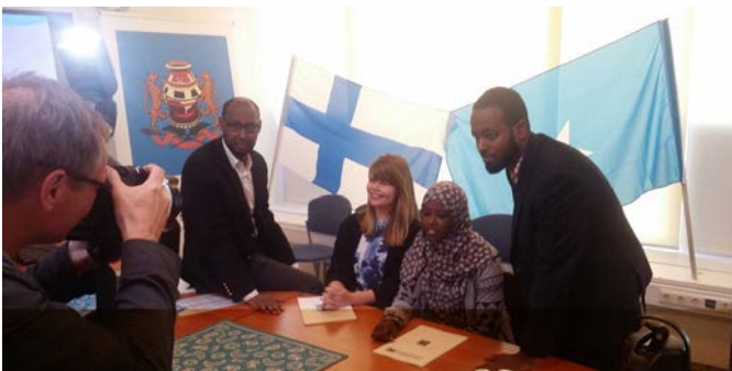
Lehdistötilaisuus Open Society Foundationin rasismia ja syrjintää kartoittavan tutkimushankkeen raportin julkaisusta.

Liitto isännöi naisten- ja ihmisoikeuksia edustavaa Somalian kansainedustajien vierailua Suomessa. Vieraille järjestettiin keskustelutilaisuus Suomen ulkoasiainministeriön erityisavustaja Pekka Haaviston kanssa.