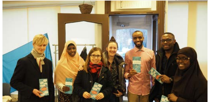
Ihmisoikeusliitto vieraili toimistolla syksyllä 2016.