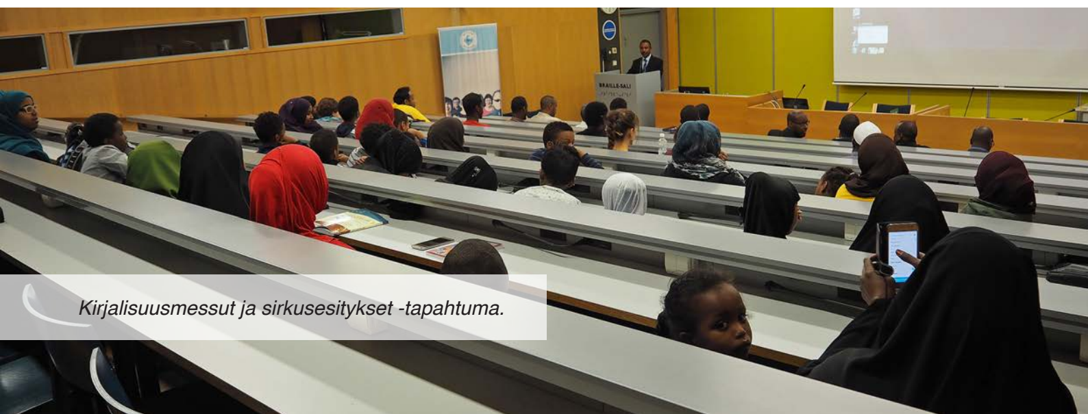
Kirjalisuusmessut ja sirkusesitykset -tapahtuma.