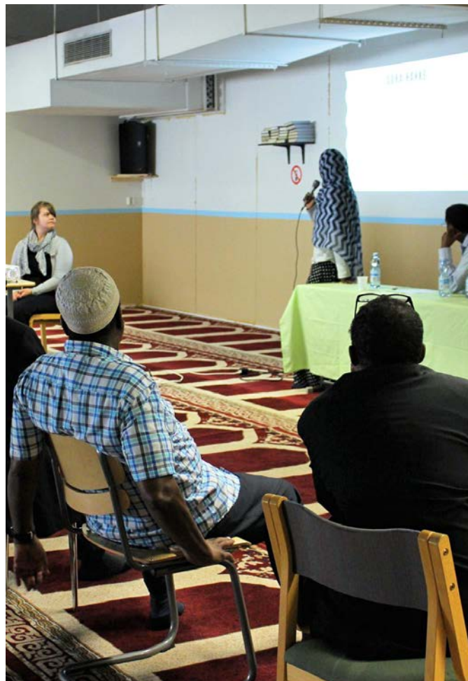
Infotilaisuus vanhemmille koulutuksesta Koivukylän moskeijassa.