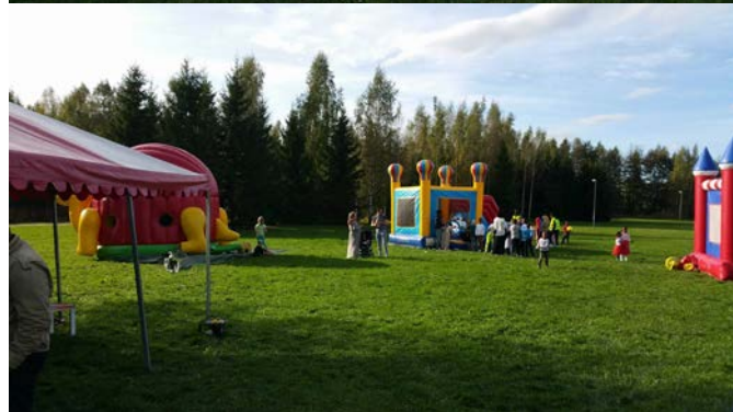
Leikkipäivä Pihlajamäen nuorisopuistossa 12.9.2016