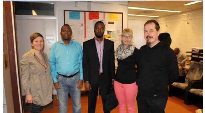
Vierailulla Joensuussa keväällä 2016