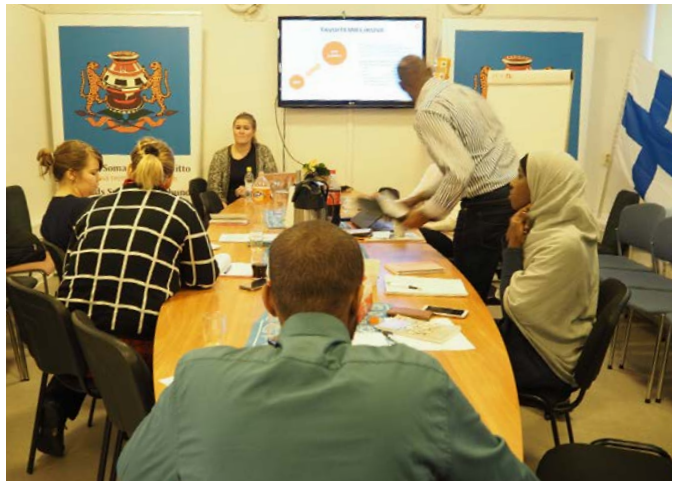
Ellun Kanat järjestivät liiton hallitukselle ja työntekijöille mediakoulutuksen vuoden lopussa 2016.

Lehdistötilaisuuksia ja haastatteluja annoimme lehdistölle, tv-kanaville sekä radioon noin 10 kertaa vuoden 2016 aikana. Kansainvälisiä haastatteluja ja katsauksia somalialaisten tilanteesta Suomessa järjestimme mm. BBC-Somalille, Somali National TV:lle sekä Universal TV:lle.