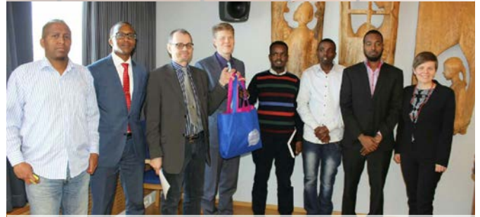
Vierailulla Lieksassa keväällä 2016