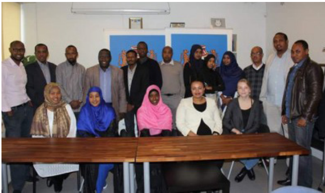
Somalian Punaisen Puolikuun presidentin vierailu.

Euroopan unionin syrjintää kartoittavan hankkeen tiimoilta oltiin yhteydessä liittoon, johon liitto antoi raportin suomensomalialaisten tilanteesta.