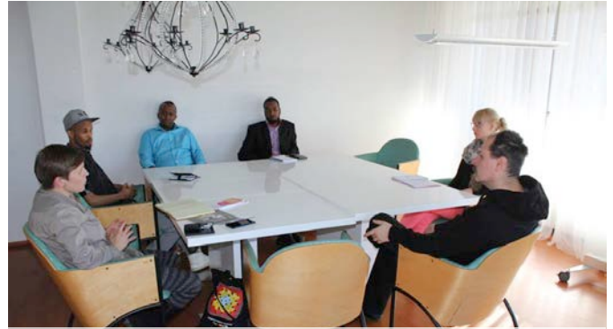
Vierailulla Lieksassa keväällä 2016

Jäsenjärjestöt pyysivät, että liitto kehittää yhteisten avustuksien hakemista, joita liitto koordinoi. Perustetaan nuoriin pohjautuva verkosto, johon jokainen jäsenjärjestö nimeää kaksi edustajaa kehittämään tätä verkostoa.