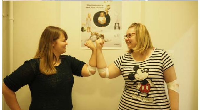
Perustimme SSL-veriryhmän syksyllä 2016.

gramin, YouTuben ja Snapchatin. Seuraajia olemme saaneet mukavasti uusillekin kanaville, mm. Instagramissa seuraajia on jo 94 kappaletta.