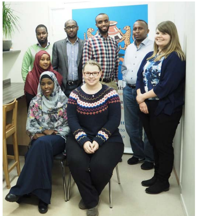
Suomen somalialaisten liiton hallituksen jäseniä ja työntekijöitä.

Suomen somalialaisten liitto Järjesti infotilaisuuksia ja opastusta työttömille ja työharjoittelijoille