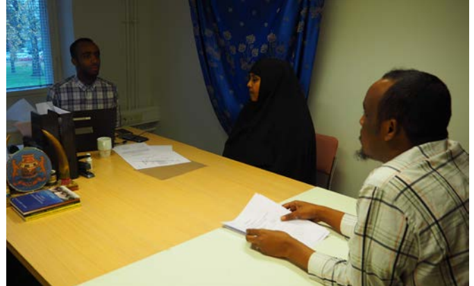
Liitto antaa yksilöneuvontaa sitä tarvitseville.

Vuoden 2016 aikana liitto oli mukana kahdessa naapurikiistassa, jotka saatiin poliisin ja syyttäjävirston kanssa yhteistyössä hoidettua. Riitojen sovittelussa olivat myöskin mukana moskeijat. Lisäksi olimme mukana kolmessa asukkaiden ja kiinteistöyhtiöiden välisessä riidoissa sovittelijana.