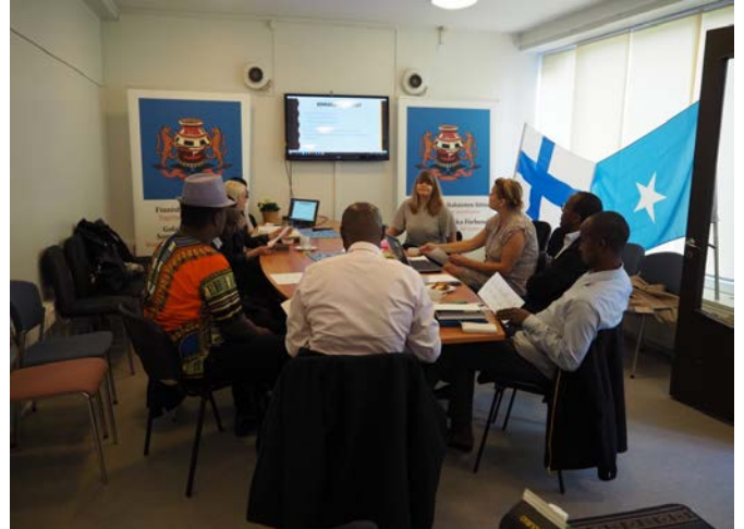
SORA -hankkeen ohjausryhmän kokous syksyllä.

18.10. järjestimme yhteisen ideointitilaisuuden, johon kutsuimme edustajia eri järjestöistä ja viranomaisista, mm. poliisista ja Helsingin kaupungin nuorisoasiainkeskuksesta, ja yhdessäideoimme tapahtumia ja toimintoja nuorille. Tapahtumassa syntyi uudenlaisia ideoita työpajojen ja tapahtumien järjestämisestä, ja kuinka nuoria voi saavuttaa parhaiten.