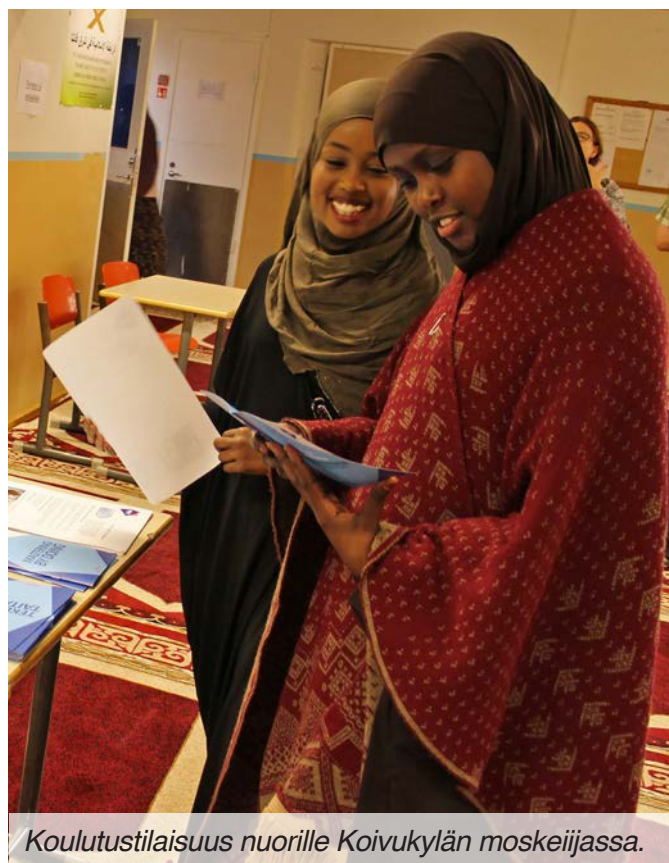
Koulutustilaisuus nuorille Koivukylän moskeijassa.

1.10. puolestaan järjestimme jälleen Koivukylän moskeijassa nuorille suunnatun koulutustilaisuuden.