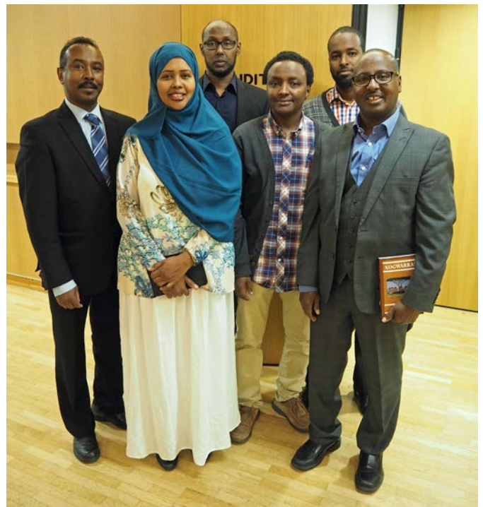
Kirjallisuusmessut ja sirkusesitykset -tapahtuma.

Järjestimme esittelytilaisuuden Itäkeskuksen IIRIS-keskuksessa Euroopan ensimmäisistä sirkusesityksistä 1800–1900 luvulla.