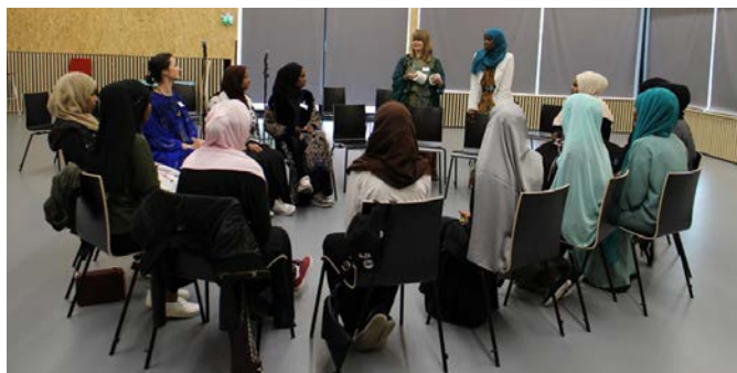
Eid -juhla tytöille heinäkuussa 2016.

tutustuttiin kansainvälisten nuorisovaihtojen toteuttamiseen ja nuorten omien projektien ohjaamiseen. 9.12 liiton tiloissa järjestettiin